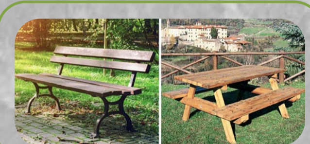
Arredi area giochi e pic-nic (Rif. Tav. P9 | Progetto del verde)