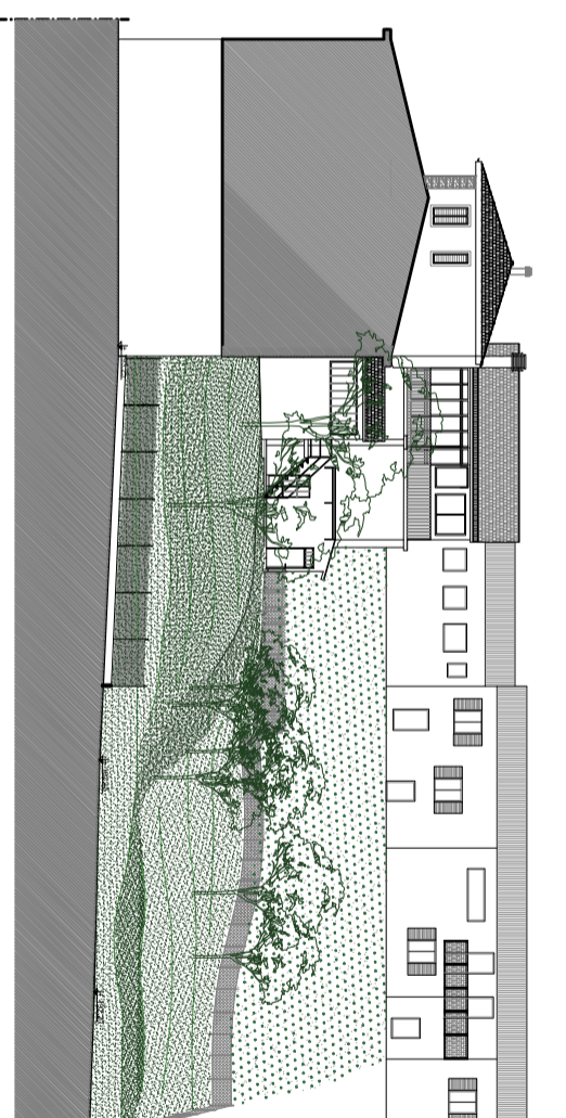
PROFILO D - D