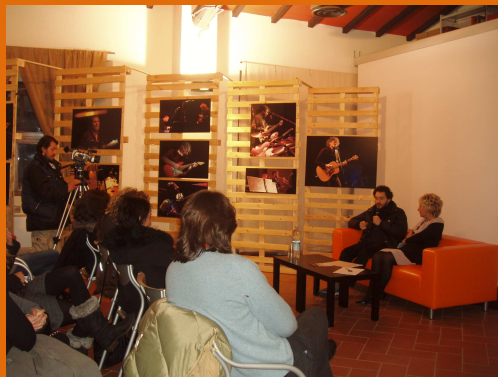
Paola Leoni intervista Claudio Santamaria durante uno dei tanti incontri con attori e scrittori presso la Biblioteca di Vicchio

Accedendo al catalogo on-line ( http://easy.cm-mugello.fi.it/easyweb/w2007/ ) è possibile cercare autonomamente, dal computer di casa o da quello della biblioteca, il libro nel patrimonio delle biblioteche comunali e scolastiche e dei Centri di Documentazione che aderiscono al sistema. La biblioteca inoltre consente di richiedere libri al sistema bibliotecario fiorentino (SDIAF), nonché ad altre biblioteche toscane e nazionali. Il prestito è gratuito, salvo eventuali spese di spedizione postale per libri richiesti a livello regionale o nazionale.